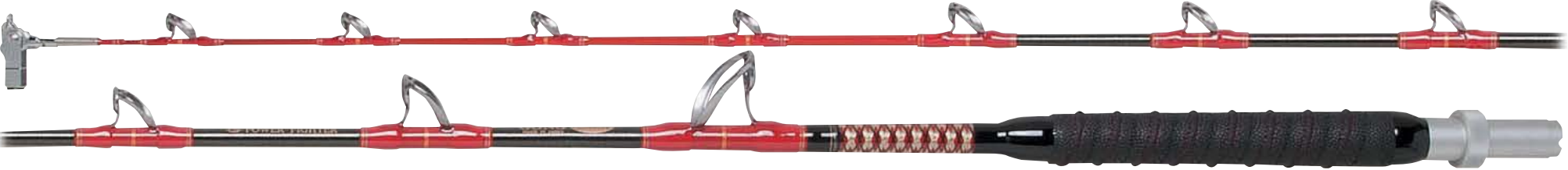
パワーファイター・ゴング 230M