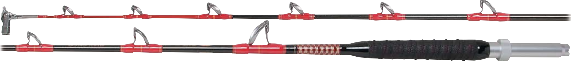
パワーファイター・ゴング 230H